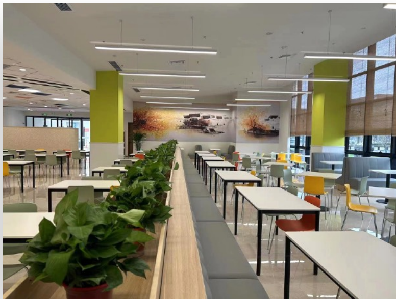
干净卫生用餐环境